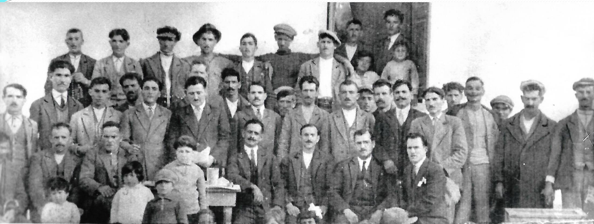
ΠΡΟΣΦΥΓΕΣ ΑΠΟ ΤΟΝ ΣΥΝΟΙΚΙΣΜΟ ΞΥΛΟΚΑΣΤΡΟΥ, ΤΟ 1926. ΤΟ ΜΕΓΑΛΥΤΕΡΟ ΠΑΙΔΙ ΕΙΝΑΙ Ο ΣΚΗΝΟΘΕΤΗΣ ΒΑΣΙΛΗΣ ΓΕΩΡΓΙΑΔΗΣ ΚΑΙ ΑΥΤΟΣ ΠΙΣΩ ΤΟΥ ΕΙΝΑΙ Ο ΠΑΤΕΡΑΣ ΤΟΥ.